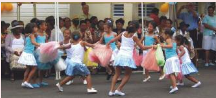
Toutes les générations en fête à Trois-Bassins