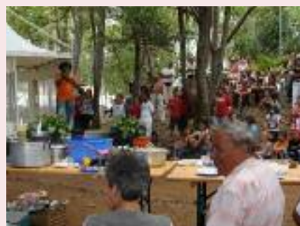
Humour et repas de partage à l'Entre-Deux