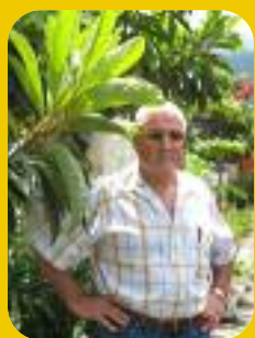
LES PENSÉES D'EAU