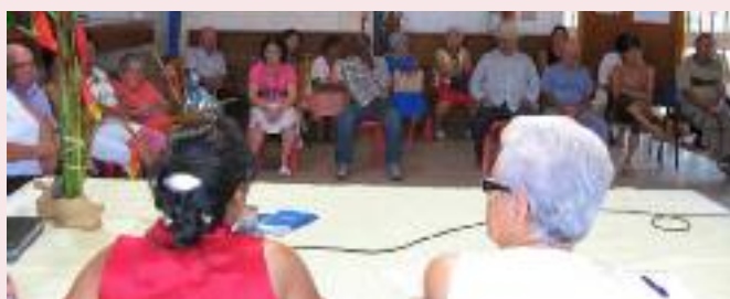
Sensibilisation au dépistage du cancer au club Ylang-Ylang à l'Étang-Salé