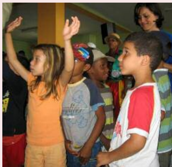
Défense de l'Environnement avec les enfants à Saint-Pierre